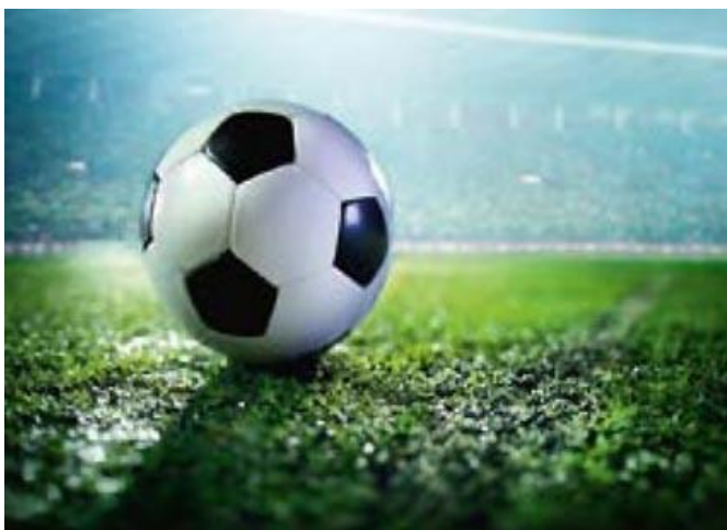
Terrain de football