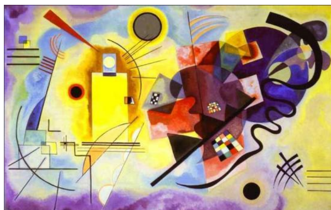
Œuvre caractéristique de l'art abstrait / « Jaune-rouge-bleu » Vassily Kandinsky