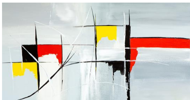
Œuvre caractéristique de l'art abstrait / Chimère » de Joelle CARIA

Donne les caractéristiques de l'œuvre abstraite ci-dessous :