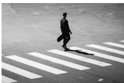
Les bandes blanches