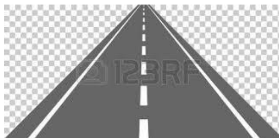
La ligne discontinue