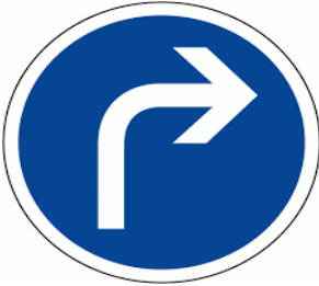
Un panneau d'obligation