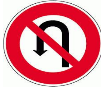
Un panneau d'interdiction