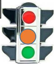
Un feu tricolore