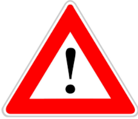
Un panneau de danger